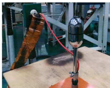
上海防雷測試中心100kA實驗現場