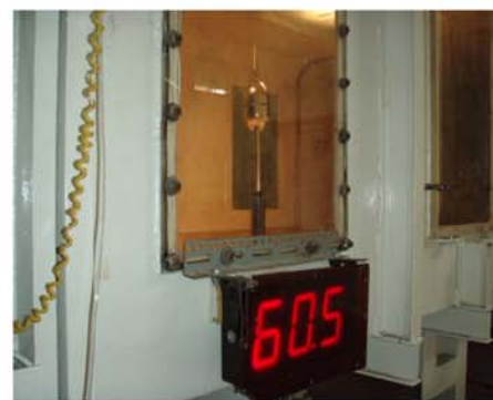
台灣航太中心17級風實驗現場