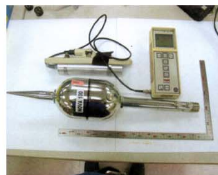
台灣SGS無輻射汙染實驗現場