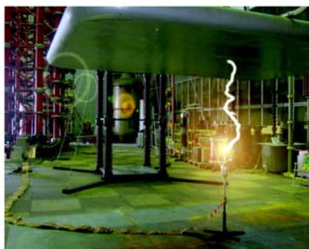
歐洲ICMET直擊雷實驗現場