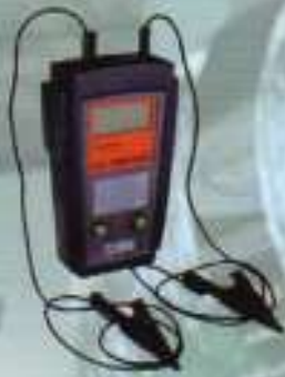
避雷針功能測試器