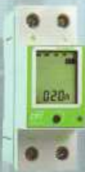
避雷針接地電阻監視器